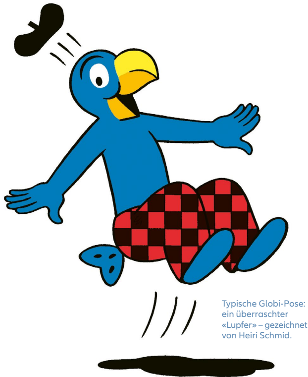
Typische Globi-Pose: ein überraschter «Lupfer» – gezeichnet von Heiri Schmid.

relativ langsam, weil ich ein sorgfältiger Schweizer bin, was meine Arbeit betrifft. Sonst bin ich so gar kein typischer Hosenträger-Schweizer – im Gegensatz zu Globi.