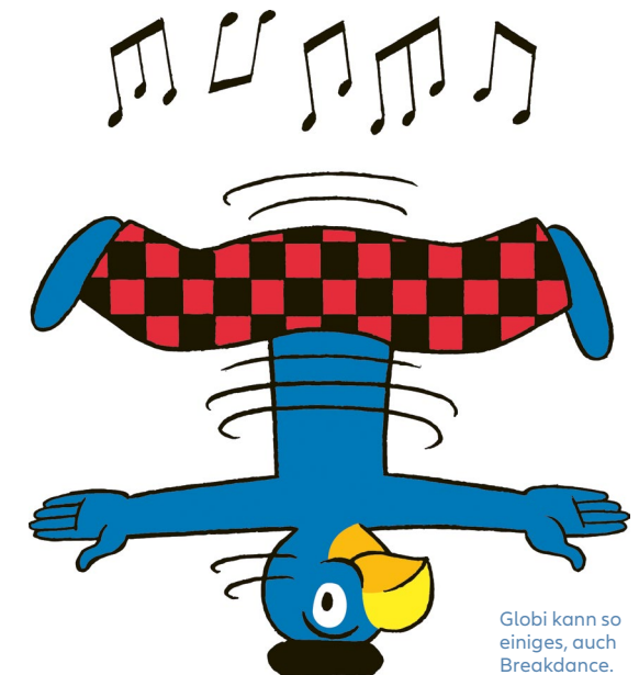
Globi kann so einiges, auch Breakdance.

Director für die Werbung und später für Magazine neben dem Illustrieren auch fotografiert – und zwar nicht nur Mode. Ich möchte gerne noch nach Amerika. Das Leben dort stelle ich mir vor wie in den amerikanischen Filmen. Vielleicht besuche ich mal meinen Enkel, der bald in Pasadena (Kalifornien) Animation und Game Design studiert.